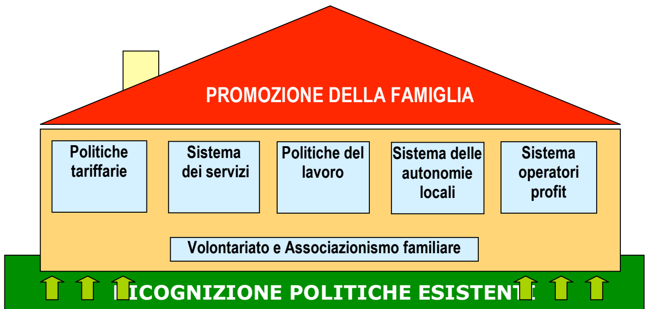
Figura n. 3 “La promozione della famiglia”